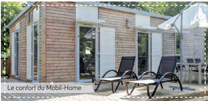
Le confort du Mobil-Home

The comfort of mobile homes / De comfortabele stacaravan