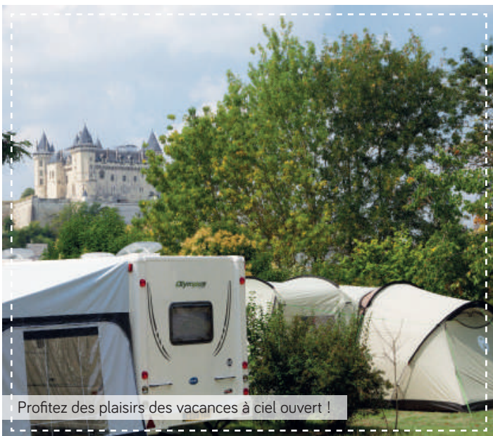
Profitez des plaisirs des vacances à ciel ouvert !

Enjoy the pleasures of an open air holiday! / Genieten van een echte buitenvakantie!