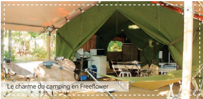
Le charme du camping en Freeflower

Notre camping vous propose des locations pour toutes envies et pour tout budget : nos locations toilées « glamping » avec nos Freeflower, nos mobil-homes classiques 1 à 3 chambres avec ou sans TV et nos nouvelles Sweetflower sur pilotis. Pour un maximum de confort, choisissez nos Mobil-homes et nos Homeflower Premium, avec draps, TV et lave-vaisselle inclus !