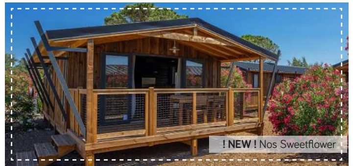
! NEW ! Nos Sweetflower

The comfort of mobile homes / De comfortabele stacaravan